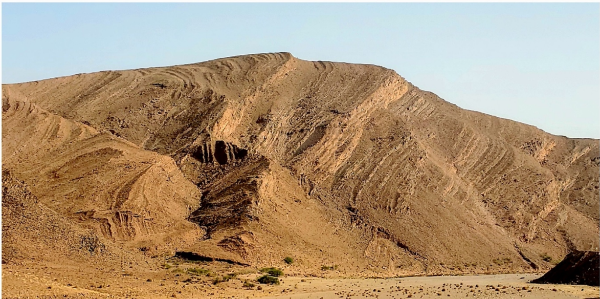
Rouler dans un tel cadre, ça bluffe !

Nous avons traversé des villages sinistrés après le séisme ; une grande partie de l'habitat avait été rasée et 90% des habitants étaient encore sous la tente, même si l'eau et l'électricité avaient été rétablies. Les gars n'ont pas les moyens de reconstruire et descendent vers des villes. Des secteurs entiers ont été touchés. Parfois il était impossible de remonter jusqu'à l'étape et nous avons pris le 4x4. Le guide était un peu désabusé.