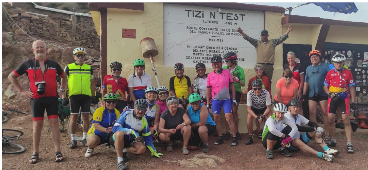
Les mêmes en mode sport !