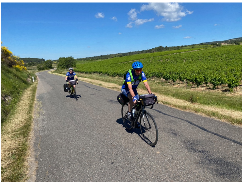
En route vers Cucugnan !

Le scoop de cette étude mirifique est clair : il n'y a pas qu'une façon d'être cyclo septua, il en existe trois, mais le plus clair est l'effort commun de chacun de ces septuas pour ne pas se transformer de septuagénaire et septuagène !