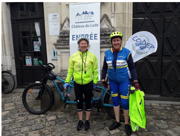
La présidente de Thouaré pilotait le tandem avec son équipière malvoyante.

Le mardi 29 mai matin au départ de Carquefou à l'UCNA se sont alignées les 47 féminines réparties en 4 groupes d'une douzaine de vélos : Moyenne d'âge 66 ans. Un tandem électrique de Thouaré pour accompagner une malvoyante. Trois VAE. Et tout le reste du groupe en musculaire ! Oui, parfaitement ! Des participantes historiques et de nouvelles recrues. Des clubs très représentés (Thouaré ou Pornic = 8 ; et d'autres seules de leur club).