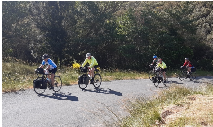
Rame, rame, rameurs ramez...

Les uns y viennent après avoir usé leurs forces en tentant de rejoindre les pelotons qu'ils retrouvent égayés sur les bords de route dans des fonctions naturelles en les attendant, les autres préfèrent anticiper et optent pour la fée dès leurs premiers signes de faiblesse. Mais tous en sortent rayonnants. L'électricité fournit largement les watts que la fonte musculaire a fait disparaître et replace aussitôt les attardés dans le peloton.