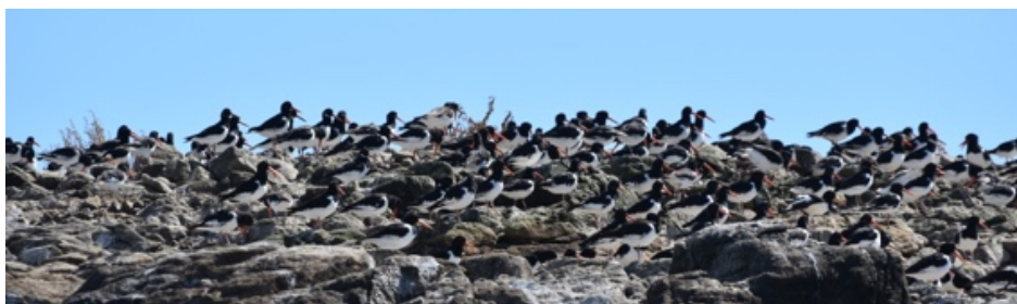
Huitriers-pie en voyage itinérant !