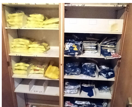
Les coupe-vent à gauche ; les maillots à droite

Tu as compris : un achat= une veste coupe-vent à moitié prix. Et c'est bien là l'essentiel. Cette veste « coupe-vent » va vite avoir avec un peu de chance la fermeture qui se bloque, et encore avec davantage de chance, se bloquer au milieu. Alors, tu auras l'impression d'avoir une double veste toujours à moitié prix : c'est mieux que les discounts les plus en vogue.